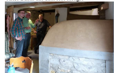
Das einzige heute noch genutzte Backs auf dem Hof Steinmeier auf der Meiningser Bauer.