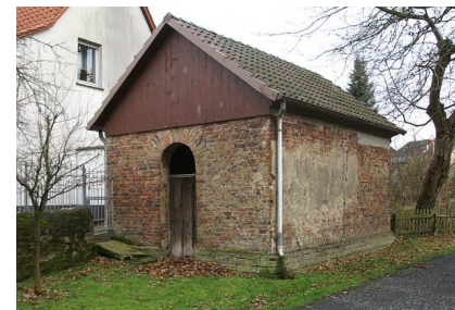
Altes Backs im Garten des Pastorats

Zum Bereiten des Brotteiges war eine gleichmäßige Wärme notwendig. Am Vorabend wurde der Backtrog deshalb neben den Herd gestellt und die Kinder angehalten, die Türen geschlossen zu halten. Ca. 50 Pfund Mehl benötigte man für den Brotteig in dem Backtrog. Mit Sauerteig und warmem Wasser wurde er gut vermischt, nachdem auch Salz hinzugefügt worden war. Durch ein Leinentuch deckte man den Teig ab, bevor er bis zum frühen Morgen ruhte.