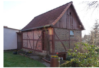
Altes Backs auf dem Hof Joest in der Twiete