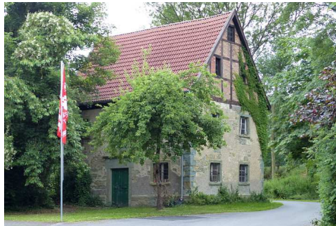
Altes Backs auf dem Hof Risse

In Meiningsen wurden im zwanzigsten Jahrhundert mindestens acht Backs genutzt.