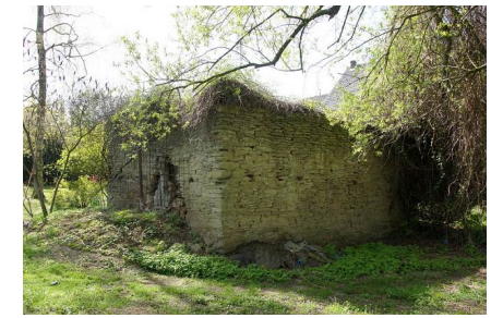
Altes Backs auf dem Hof Blumendeller

Alle 14 Tage wurde gebacken, nachdem man wenige Tage vorher das Korn zur Mühle gebracht hatte, um es mahlen zu lassen. Mancher erinnert sich vielleicht noch an die weißen Mehlsäcke aus Leinen mit dem Namen des Eigentümers versehen, den man mittels einer Schablone und schwarzer Farbe aufbrachte.