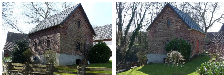
Das alte Backs auf dem Hof Müller in der Springstraße. Der alte nicht mehr genutzte Ofen steht quasi im Keller (grauer Anstrich) des Gebäudes.

Meistens bestand ein sogenanntes "Backs" aus nur einem Raum, evtl. mit einem Nebenraum, in dem die Sprickelholzbunde (Sprickel = dürres Holz) zum Anheizen, aufbewahrt wurden. Das eigentliche Backholz, die "Spellern" (Ein Scheit/Stück Holz), stapelte man außen am Backhaus.