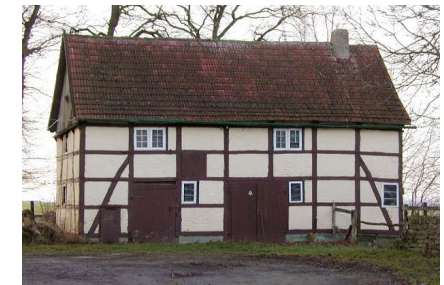
Altes Backs auf dem Hof Hengst